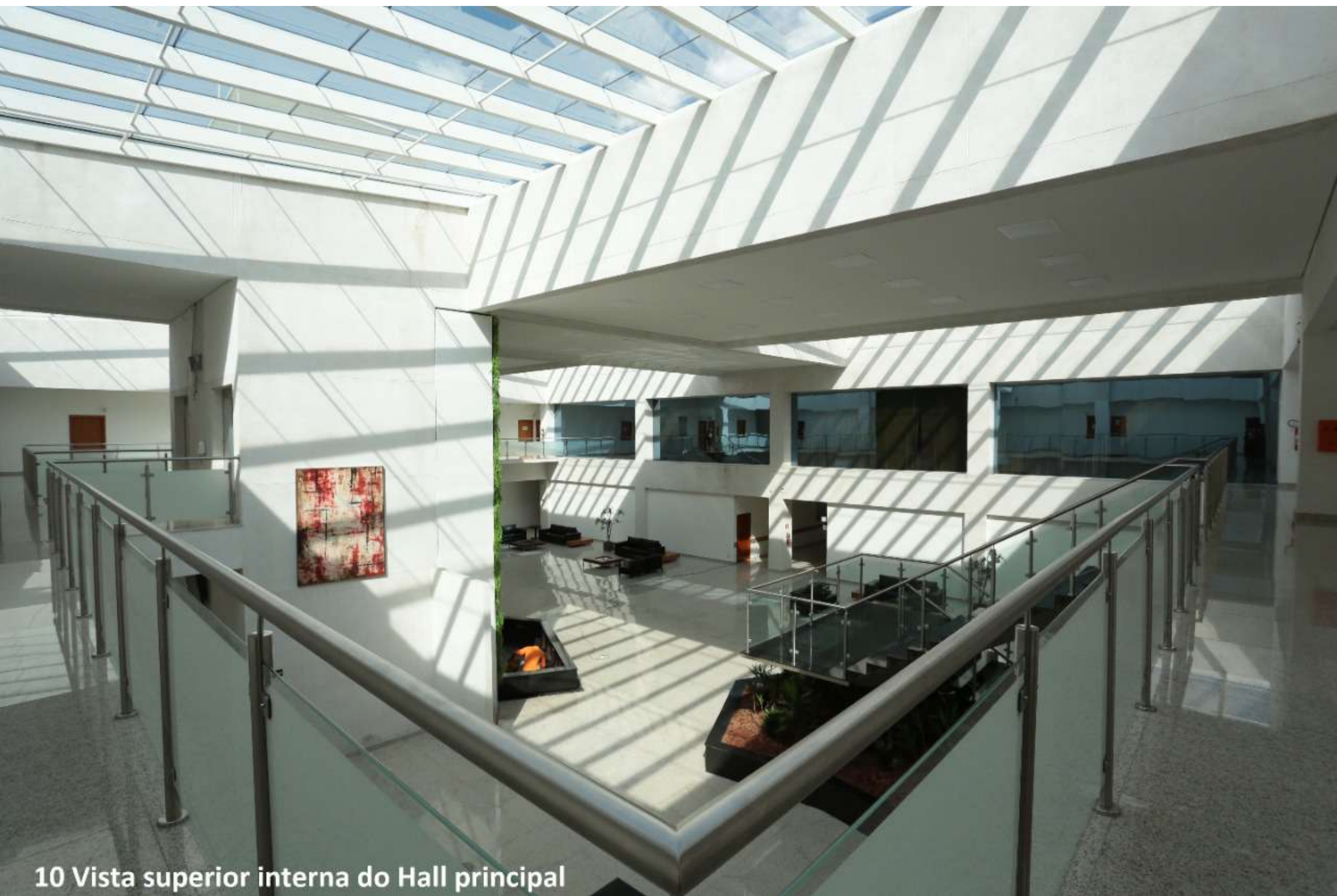
10 Vista superior interna do Hall principal