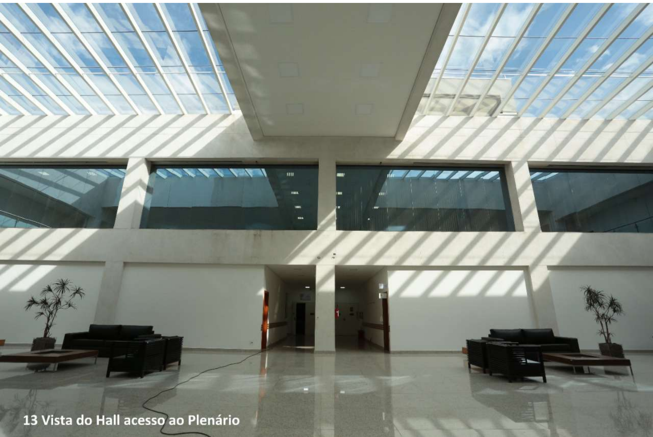
13 Vista do Hall acesso ao Plenário