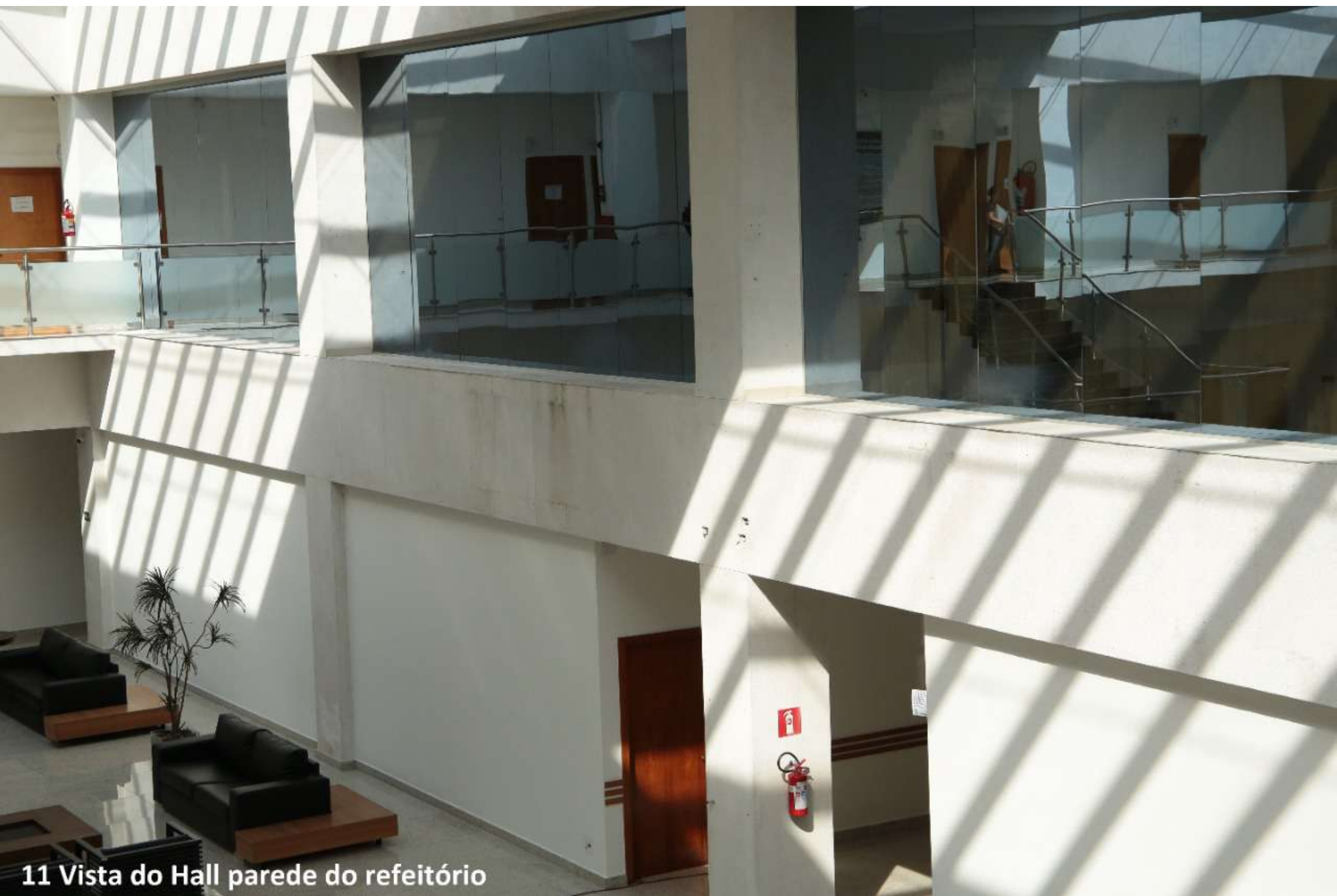
11 Vista do Hall parede do refeitório