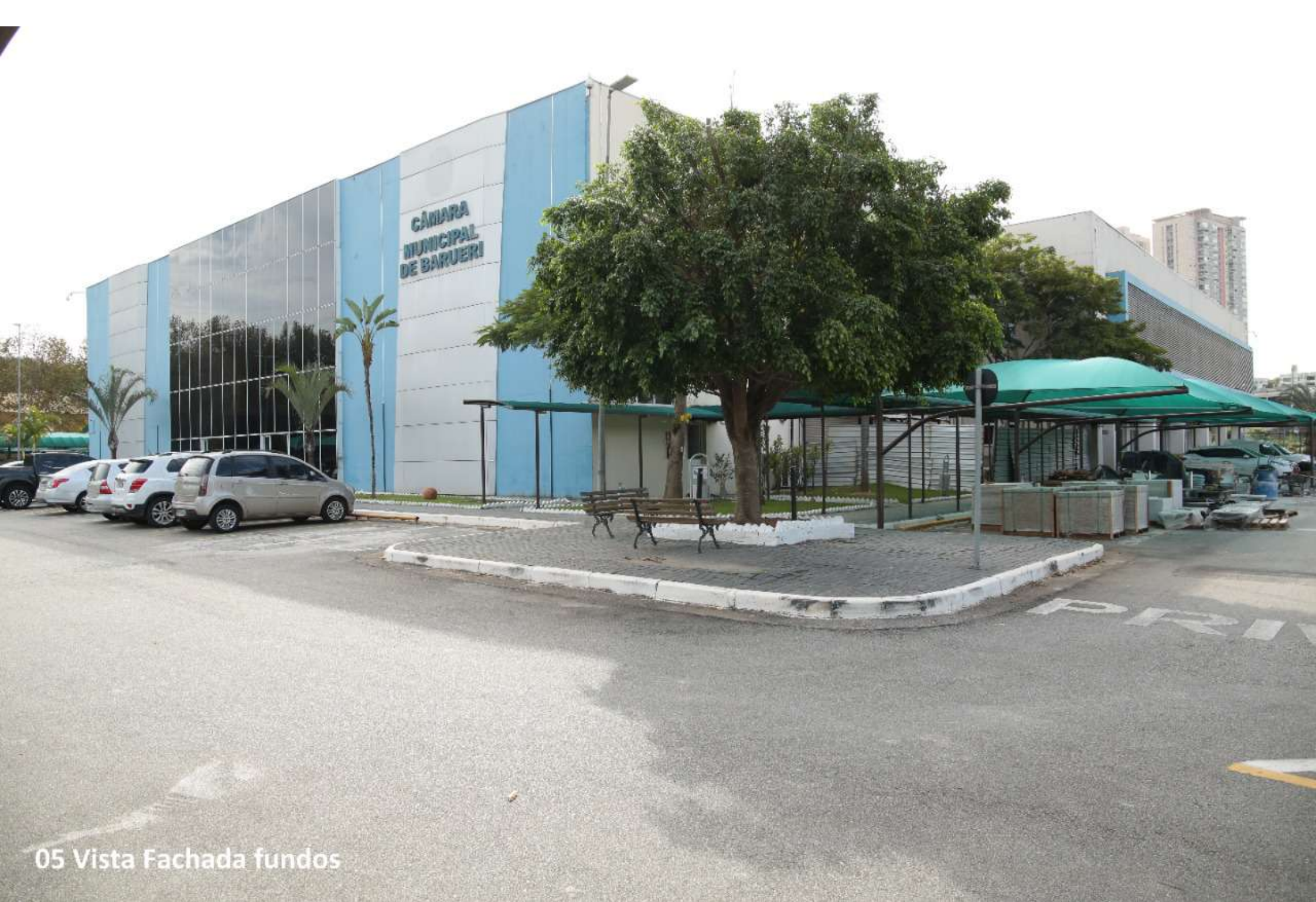
05 Vista Fachada fundos