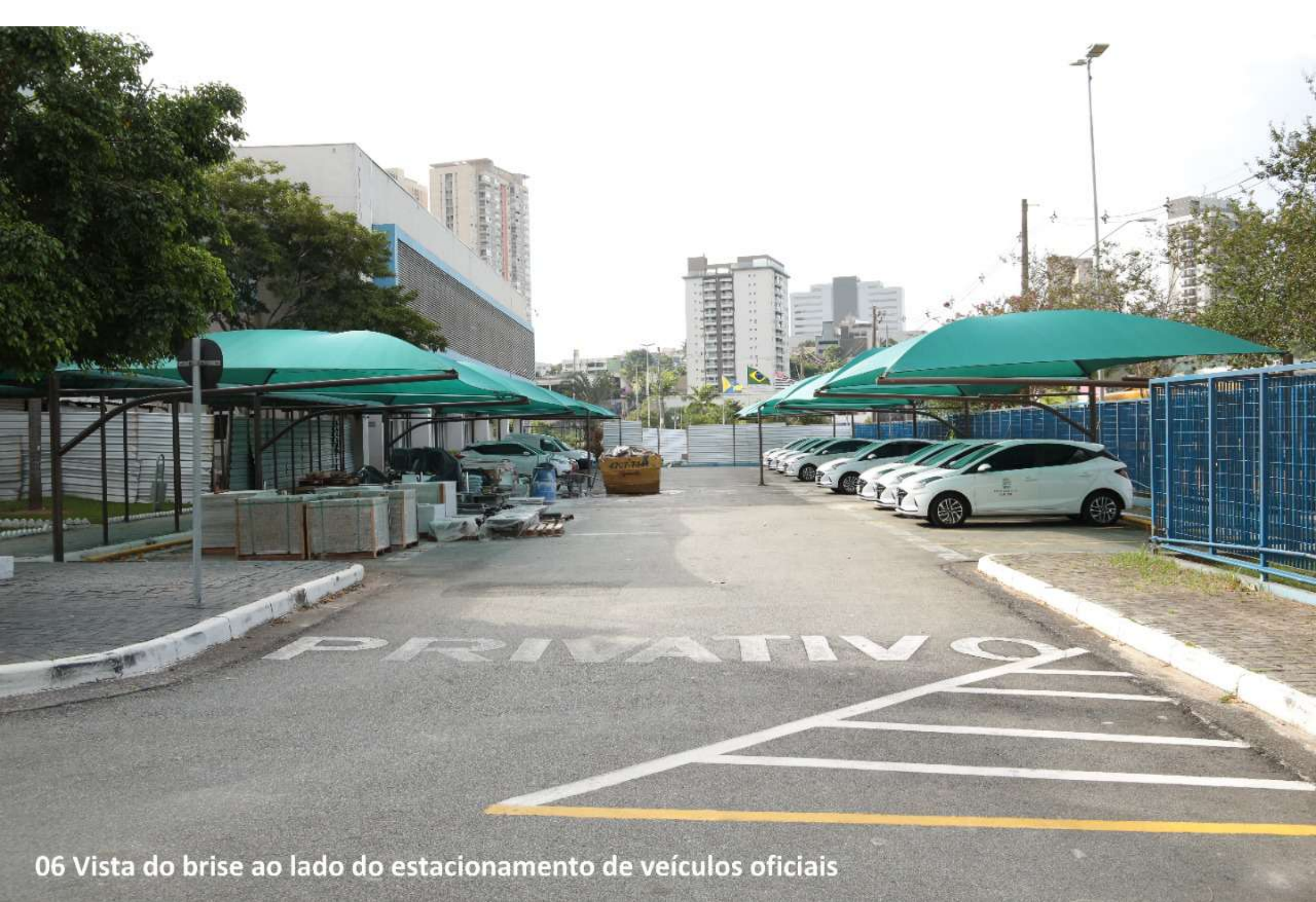
06 Vista do brise ao lado do estacionamento de veículos oficiais