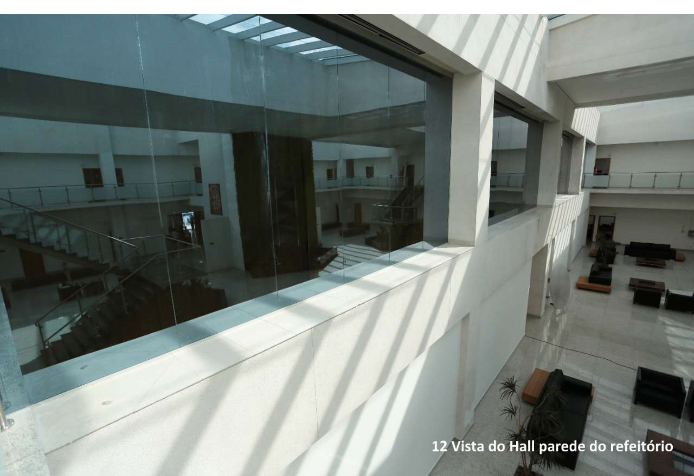
12 Vista do Hall parede do refeitório