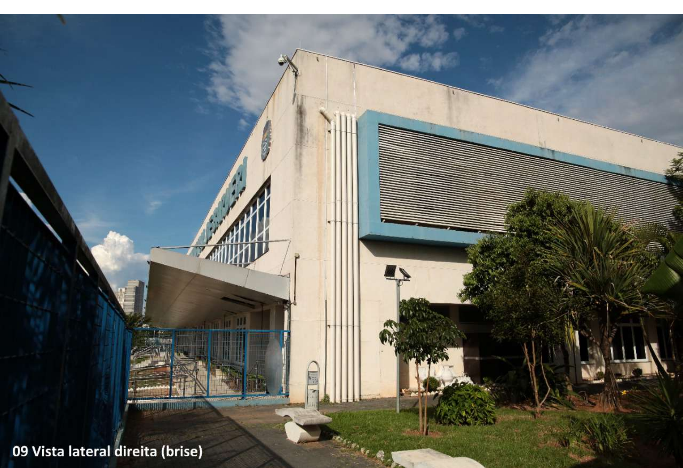
09 Vista lateral direita (brise)