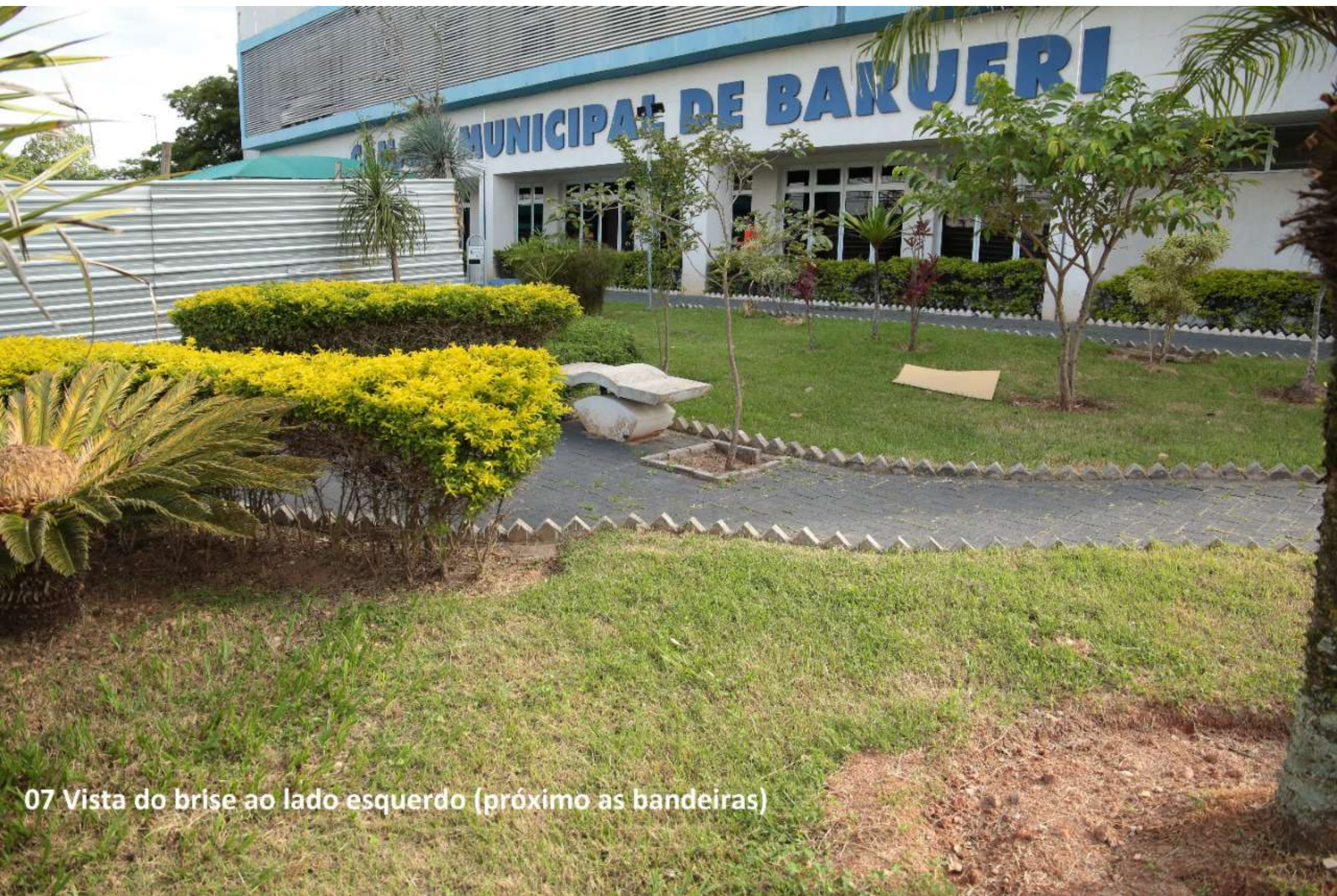
07 Vista do brise ao lado esquerdo (próximo as bandeiras)