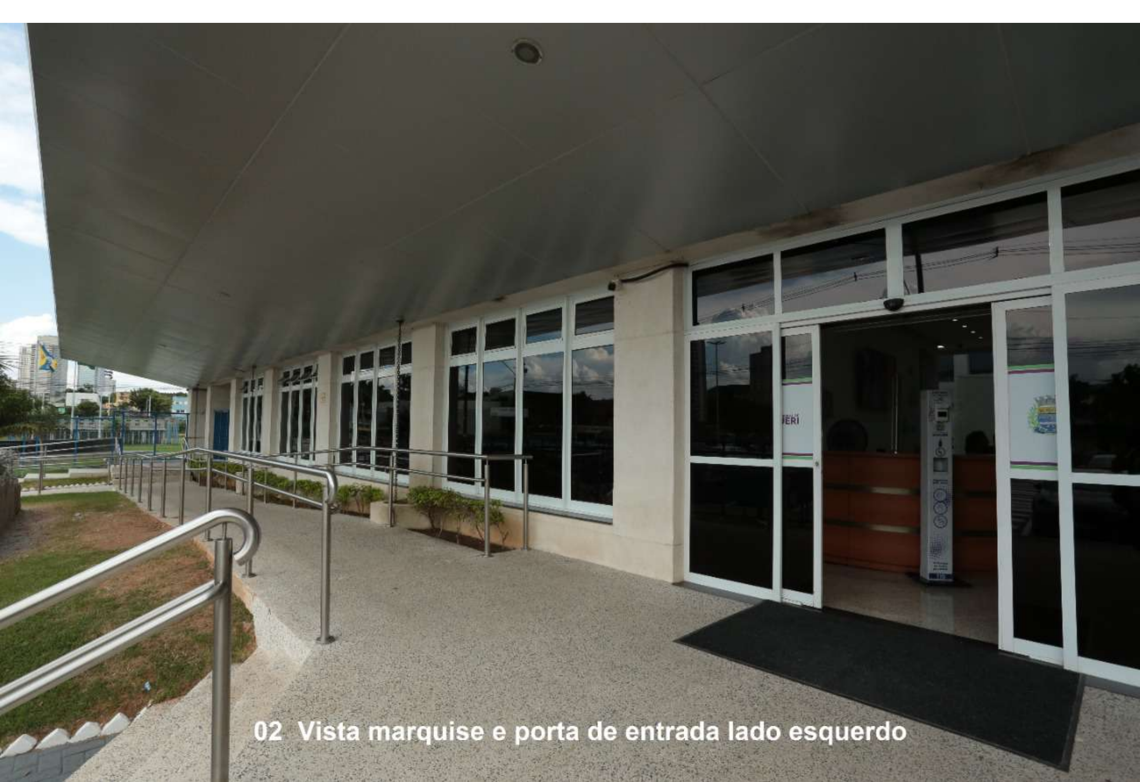
02 Vista marquise e porta de entrada lado esquerdo