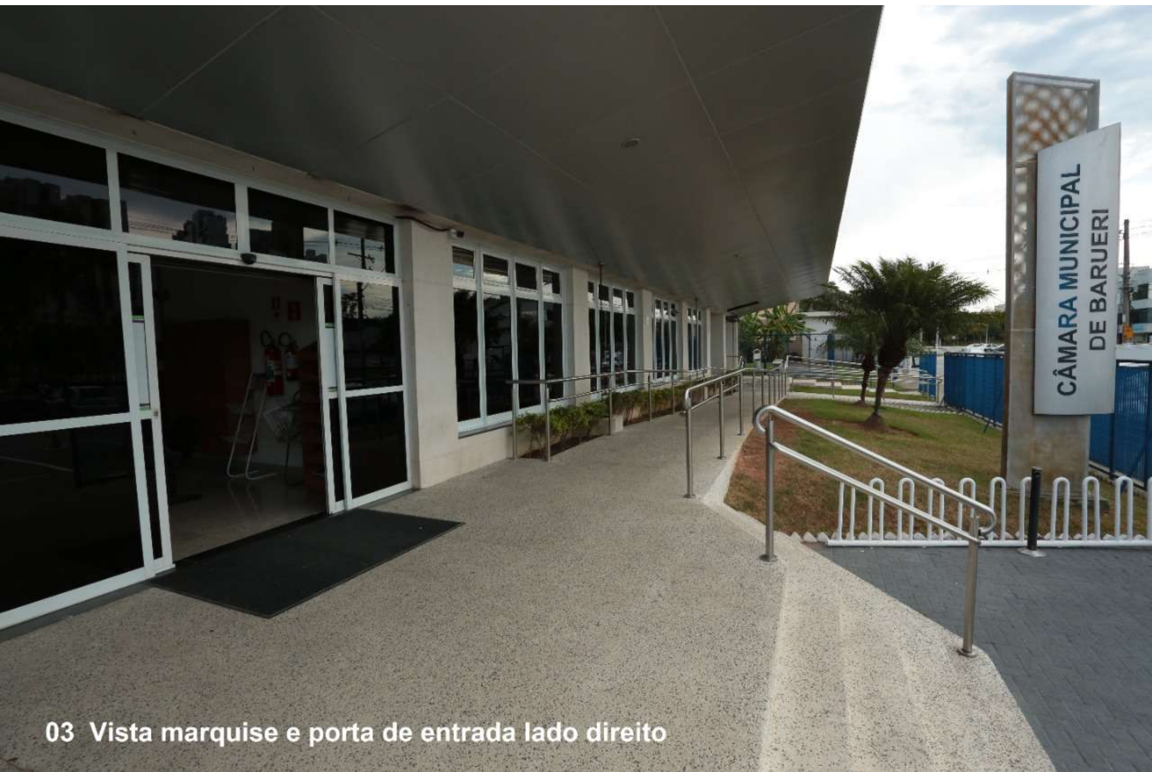
03 Vista marquise e porta de entrada lado direito