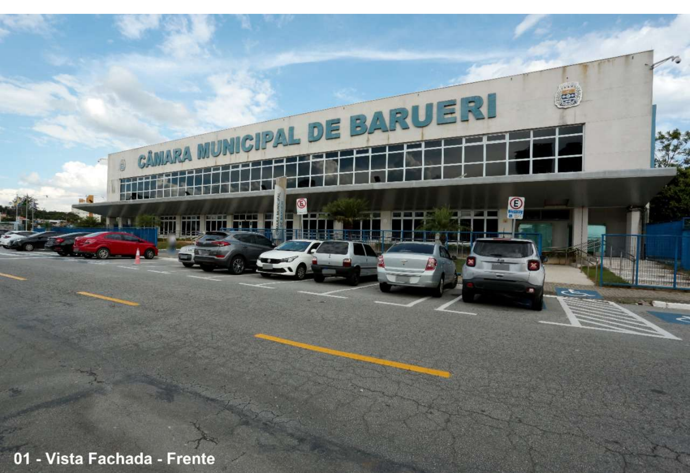
01 - Vista Fachada - Frente