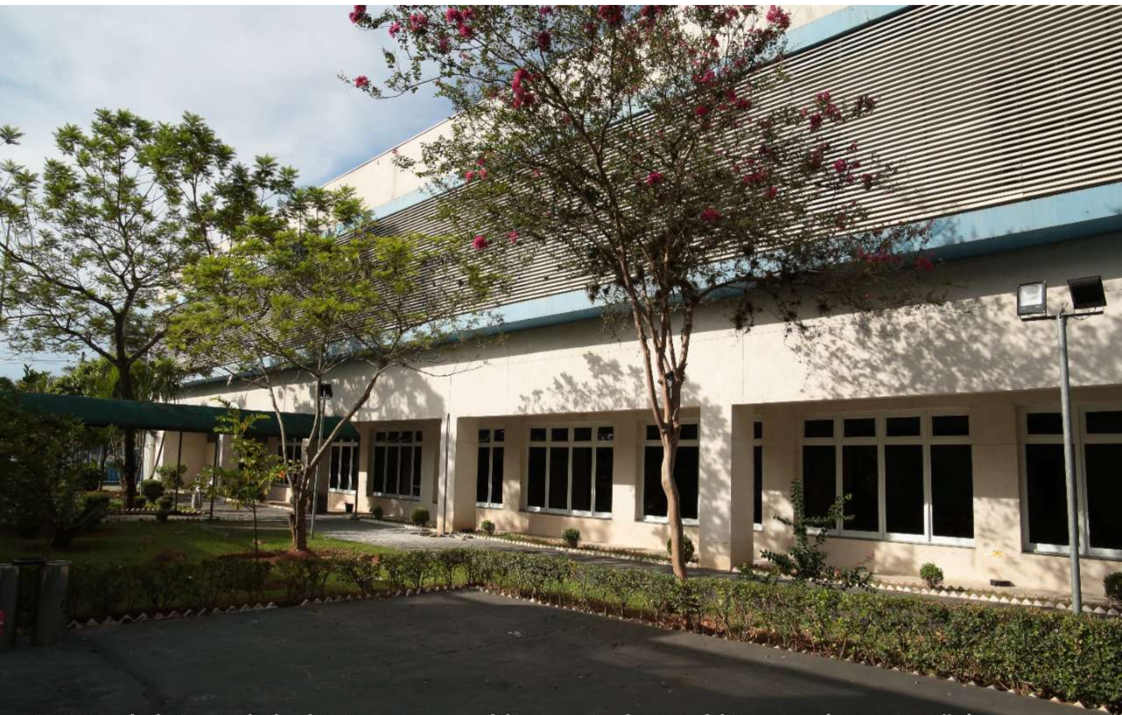
08 Vista do brise ao lado direito entre o prédio principal e o prédio anexo (manutenção)