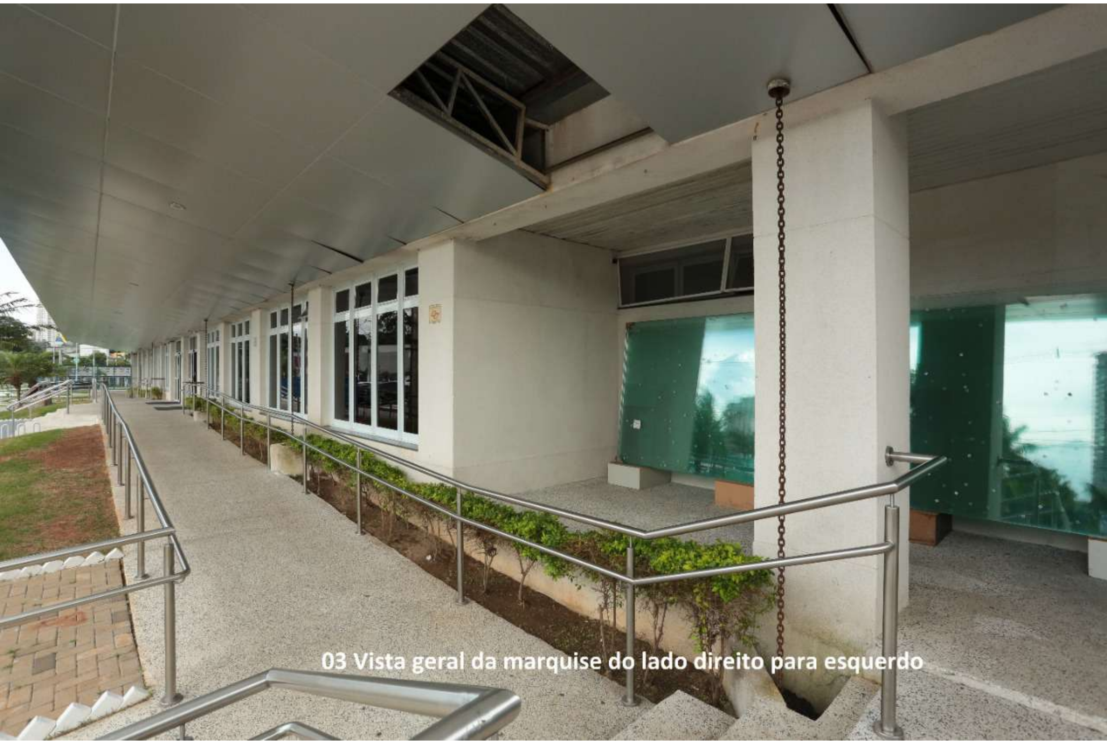
03 Vista geral da marquise do lado direito para esquerdo