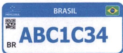
Figura 2. Modelo Emplacamento Padrão Mercosul Oficial

2.3. Caberão aos Gestores e Fiscais do contrato o recebimento do objeto e a verificação de que foram cumpridos os termos, especificações e demais exigências, de acordo com o item 6.3 do Termo de Referência , por meio dos TERMOS PROVISÓRIO E DEFINITIVO (ANEXO VIII) .