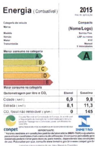
Figura 1. Etiqueta fornece informações ao consumidor